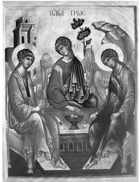
Bild: Ikone „Heilige Trinität“

Sowohl im Leben der Kirche als auch in unserem eigenen Leben wird es Zeiten geben, in denen wir unterschiedlich glauben: Wer gerade viel zu leiden hat, wird wenig mit dem allmächtigen Schöpfergott anfangen können, aber sich vielleicht im leidenden Menschen Jesus wiederfinden und ihn an seiner Seite glauben. Wer hingegen gerade die wunderbare farbenprächtige Natur bestaunt, wird aus vollem Herzen Gott als den Schöpfer loben. Und der Heilige Geist? Er bleibt in unserem Glauben meistens seltsam unkonkret, zumal er ja gerade weht, wo er will. Aber er ist die Kraft, die uns überhaupt erst glauben lässt, wenn uns der Vater zu weit weg